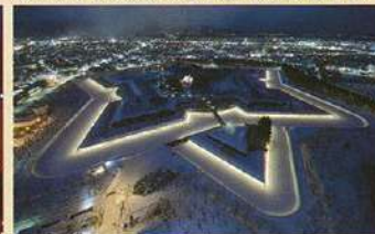
고료 별의 꿈(호시노유메) 일루미네이션(12월~2월)