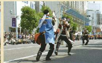
하코다테 고료카쿠 축제 (5월 제3 토, 일요일)