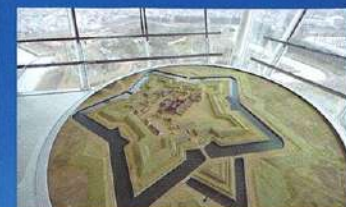
고료카쿠 복원 모형(1/250)

전망 2층은 특별사적 고료카쿠의 박력 넘치는 보실 수 있는 전망대이자 고료카쿠의 역사를 배울 수 있는 전시 스페이스입니다. 「고료카쿠 복원 모형」은 준공 당시의 고료카쿠 모습을 정확하게 재현하고 있어서 현재의 모습과 당시 모습을 비교하면서 보실 수 있습니다. 그래픽 전시 「고료카쿠 이야기」는 페리 내항부터 시작되는 고료카쿠 역사를 연표와 그림 도면으로 알기 쉽게 소개. 그리고 16개의 정경 모형 「메모리얼 홀」을 통하여 고료카쿠가 거처온 격동의 역사와 사람들의 드라마를 직접 보실 수 있습니다. 고료카쿠에 대한 질문과 의문은 정보 검색 컴퓨터 「고료카쿠 가이드」로 조사해 보십시오. 고료카쿠와 타워의 모습을 실감할 수 있는 「만질 수 있는 모형」도 등장. 고료카쿠 역사의 모든 것이 여기에 있습니다.