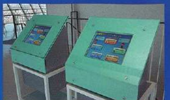
고료카쿠 가이드(컴퓨터 정보 검색)