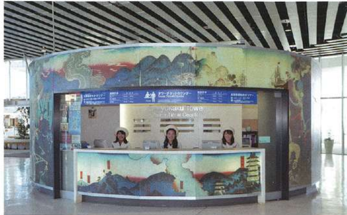
타워 티켓 카운터

전망대에서 멀리 바라보이는 하코다테산과 쓰가루 해협. 대지에 빛나는 별 특별사적 고료카쿠를 전망.