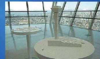
만질 수 있는 모형