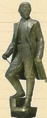
「고료카쿠의 히지카타 도시조 상」 (동상, 고데라 마치고 석)

초여름은 「하코다테 고료카쿠 축제」. 페리 제독의 내항으로 시작되는 고료카쿠의 역사를 주제로 한 유신 행렬이 거리를 행진합니다. 그리고 한여름 밤에 하코다테 역사를 재현하는 「시민 창작 하코다테 야외극」. 고료카쿠의 해자와 돌담이 화려한 무대가 됩니다. 「고료 별의 꿈(호시노유메)」은 별 모양 해자 주위를 2,000개의 일루미네이션으로 장식하는 것입니다. 현재의 고료카쿠는 시민문화의 발신지입니다.