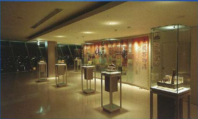
메모리얼 홀 / 그래픽 전시