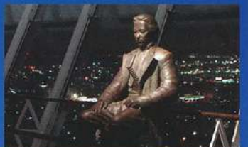
히지카타 도시조 동상(브론즈 복상) 고대라 마지코 작