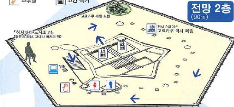
전망 2층 (90m)