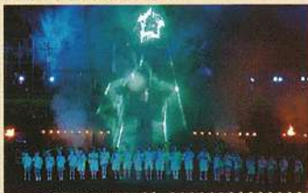
시민 창작 하코다테 야외극 (7월~8월)