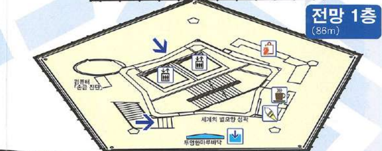
전망 1층 (88m)