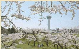
벚꽃의 명소 고료카쿠 공원