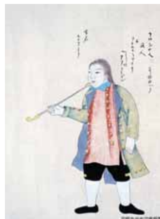
アダム・ラクスマン

幕府は、寛政11年(1799)に、東蝦夷地海岸地帯の直轄の他、享和2年(1802)には、蝦夷奉行(後に箱館奉行)を箱館に置き、文化4年(1807)には、松前藩を奥州梁川(福島県)に移封させ、文政4年(1821)まで全蝦夷地を直轄します。